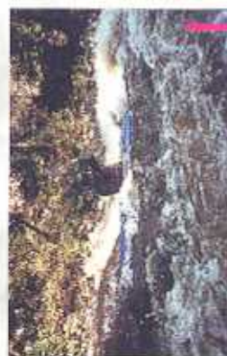
Vigémois-Estivaux : un parcours "Ecole" pour l'apprentissage de l'eau-vive