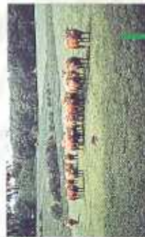
Vaches limousines sgrasses par le passage de canoës. Éviter d'effrayer les troupeaux lors des descentes.