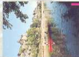
Vue de la ville d'Uzerche, en aval de la base de la Minoterie