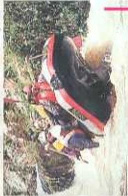
Sensations fortes en raft en aval du pont Fmout

Ce parcours se présente plus de difficulté majeure. La vallée s'ouvre légèrement, le débit augmente car l'usine restitue l'eau captée au barrage de Treignac juste avant le pont La Peyre. S'il est possible de débarquer en rive droite avant le pont La Peyre, la descente peut se prolonger jusqu'au Pont des Isles. Le débarquement se fait dans ce cas en rive droite.