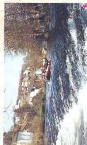
La Vézère à partir de Vigémois : un parcours idéal pour la pratique du Raft si le niveau d'eau est suffisant...