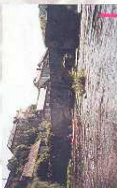
La Vézère au départ du pont de Vigémois