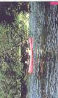
Des rambouilles s'arrivent pour une pose proprio-digue

L'embarquement se fait au pied du pont de Peyrissac en rive droite. Après environ 2 km, avec quelques petits rapides, le déversoir du Moulin du Verdier est un obstacle franchissable en son centre (un repêrage semble nécessaire avant le franchissement).