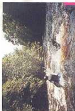
La présence de gros blocs rocheux et le fort débit rendent le parcours assez technique.

Au niveau de l' Eguese (virage à gauche très prononcé, petite rupture de pente), la Vézère entame une boucle vers l'ouest et les versants aux pentes fortes sont resserrés. Une aire de pique-nique est aménagée en rive gauche juste avant le passage des Serpents. Le passage des Serpents (belle succession de rapides) et les gros train de vagues suivant, 800 m en aval, (le Gros Train pour certains kayakistes du Limousin) annoncent l'arrivée dans les méandres de Comborn où domine le Château du même nom. La sortie de ce méandre coïncide avec l'arrivée de ce parcours. Le débarquement s'effectue en amont du pont d'Estivaux, rive gauche.