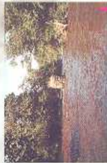
Des rambis qui témoignent d'un ancien paysage sur la Vézère