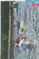
Navigation sur le lac des Barrousses lors des 1000 Pagineux